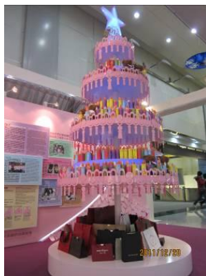
台湾桃園国際空港にて